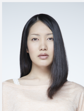
性同一性障害をカミングアウトして 活躍中のシンガーソングライター